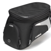
Brašna na nádrž pro model City