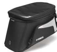
Brašna Tour na nádrž